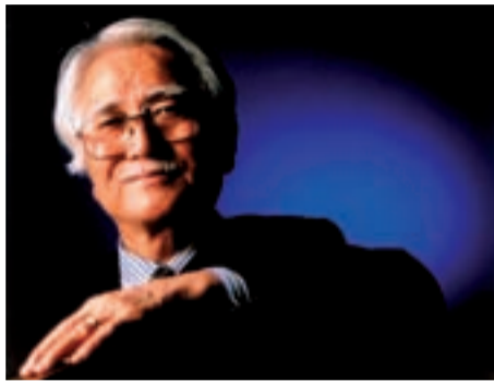
MR IMAI Känd som "The Lean Guru", grundaren av Kaizen Institute och upphovsmannen bakom Continuous Improvement (CI). Imai är också en pionjär i arbetet med att sprida filosofin kring KAIZEN® runt om i världen.